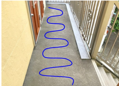
モップ掛け・悪い例