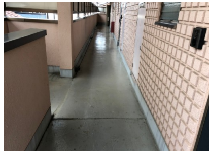
モップ掛け・良い例